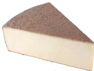
シュロックスパーガー