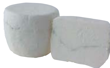
シェーヴルワサビ

カマンベールのような、キュートな木箱に入っているのは、『パティスリー・ジュダン』の手作りチーズケーキ。それぞれ、日本、フランス、イタリア、デンマーク、ニュージーランド、オーストラリアの計6カ国で生産されたフレッシュチーズを使い、1つずつ手焼きで焼きあげました。3種入りの木箱は、贈答品にもぴったり。お気に入りを見つけひ見つけて! 〔国産〕