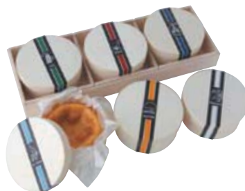
プティ ガトードール 6種

シェーヴルの名産地である、ロワール地方産の灰をまぶした(サンドレ)チーズ。組織がキュッと引き締まり、きめ細かいのが魅力で、柔らかなフレから、堅いセックまで熟成の変化を楽しめる、幅の広さが特長です。さわやかな酸味とミルクのうまみのバランスを楽しんで。フレッシュサラダとともに召し上げのもおすすめです。外貨はお好みでどうぞ!! 〔フランス産〕