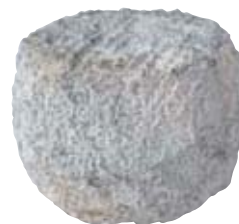
ボンド ドウ ソローニュ

直径56cmととても大きなこのチーズ。代々受け継がれている伝統の製法で手作りされています。放牧された牛の生ミルクを使用し、熟成は最低でも6ヶ月、最長は17ヶ月にも及びます。旬は4月～10月。しっとりとした食感と、ギュッと詰まったうまみが魅力。厚めに切ってそのままオードブルにしたり、薄めにスライスして季節の野菜とカルパッチョ風に。〔スイス産〕